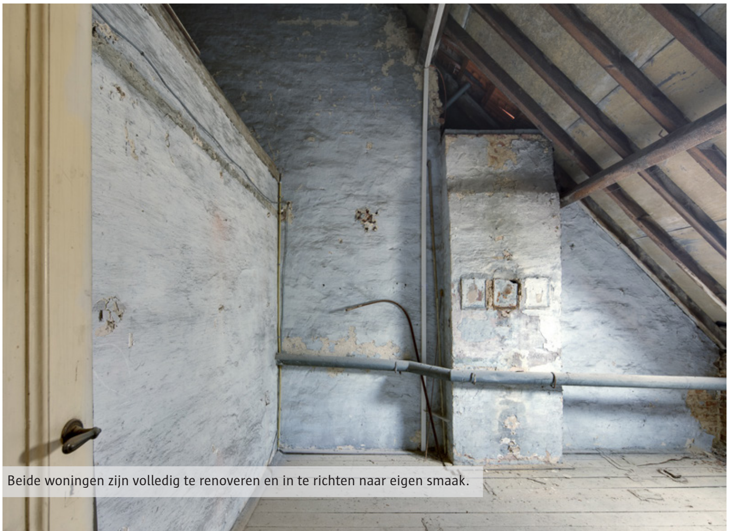
Beide woningen zijn volledig te renoveren en in te richten naar eigen smaak.