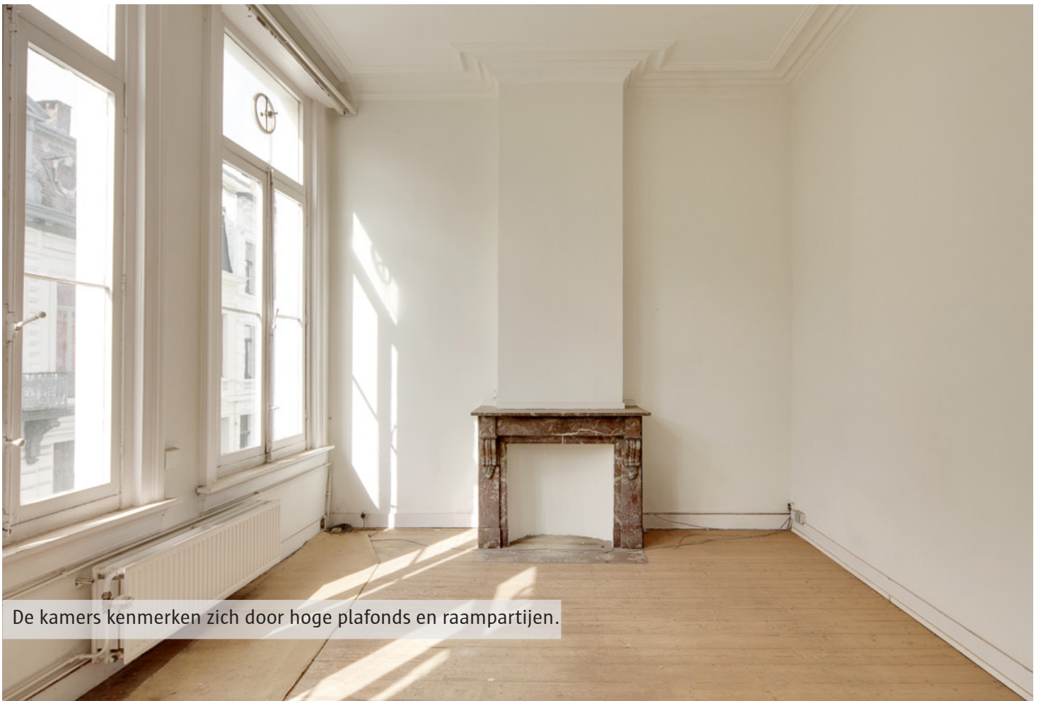
De kamers kenmerken zich door hoge plafonds en raampartijen.